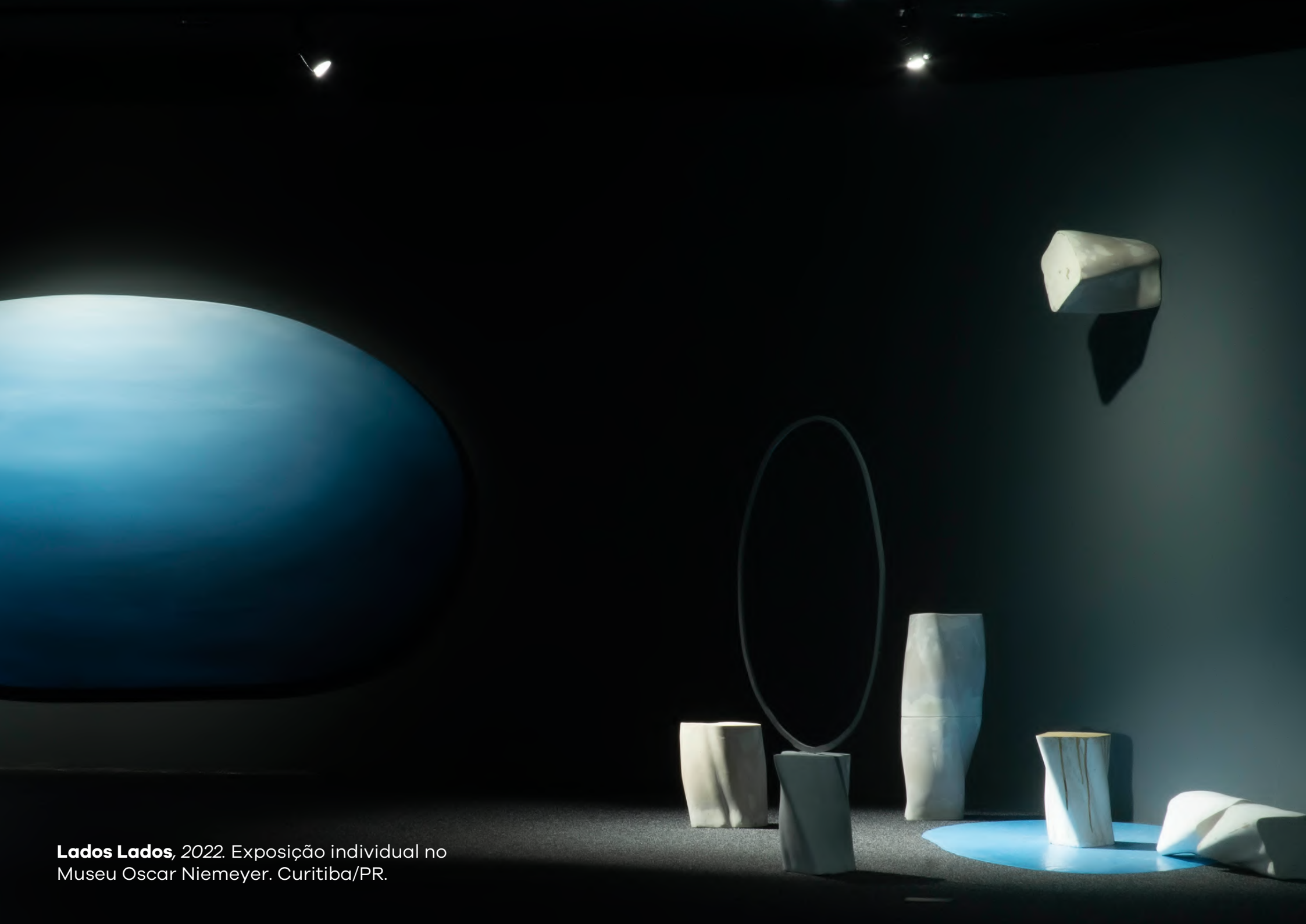
Lados Lados , 2022. Exposição individual no Museu Oscar Niemeyer. Curitiba/PR.