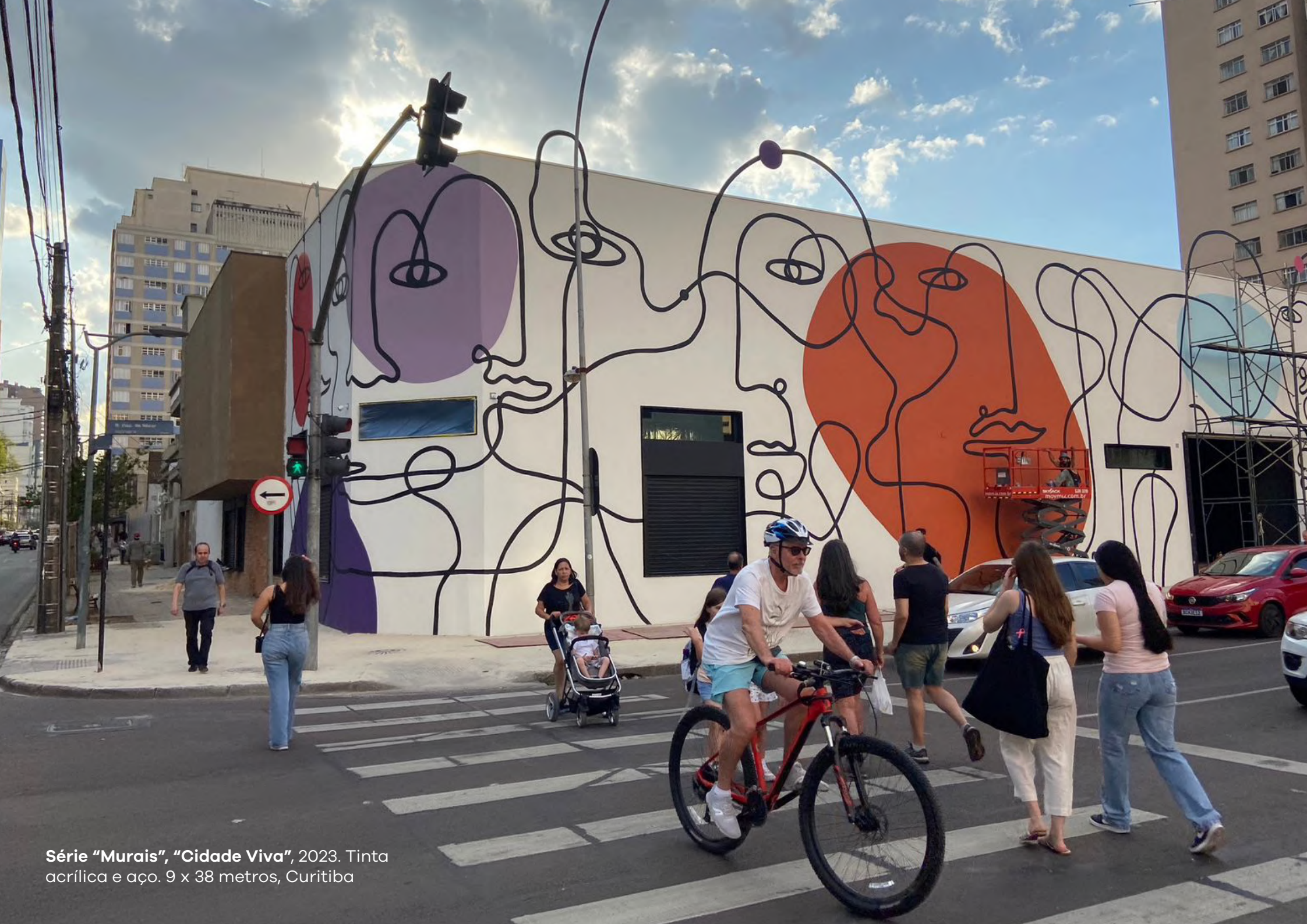
Série "Murais", "Cidade Viva", 2023. Tinta acrílica e aço. 9 x 38 metros, Curitiba