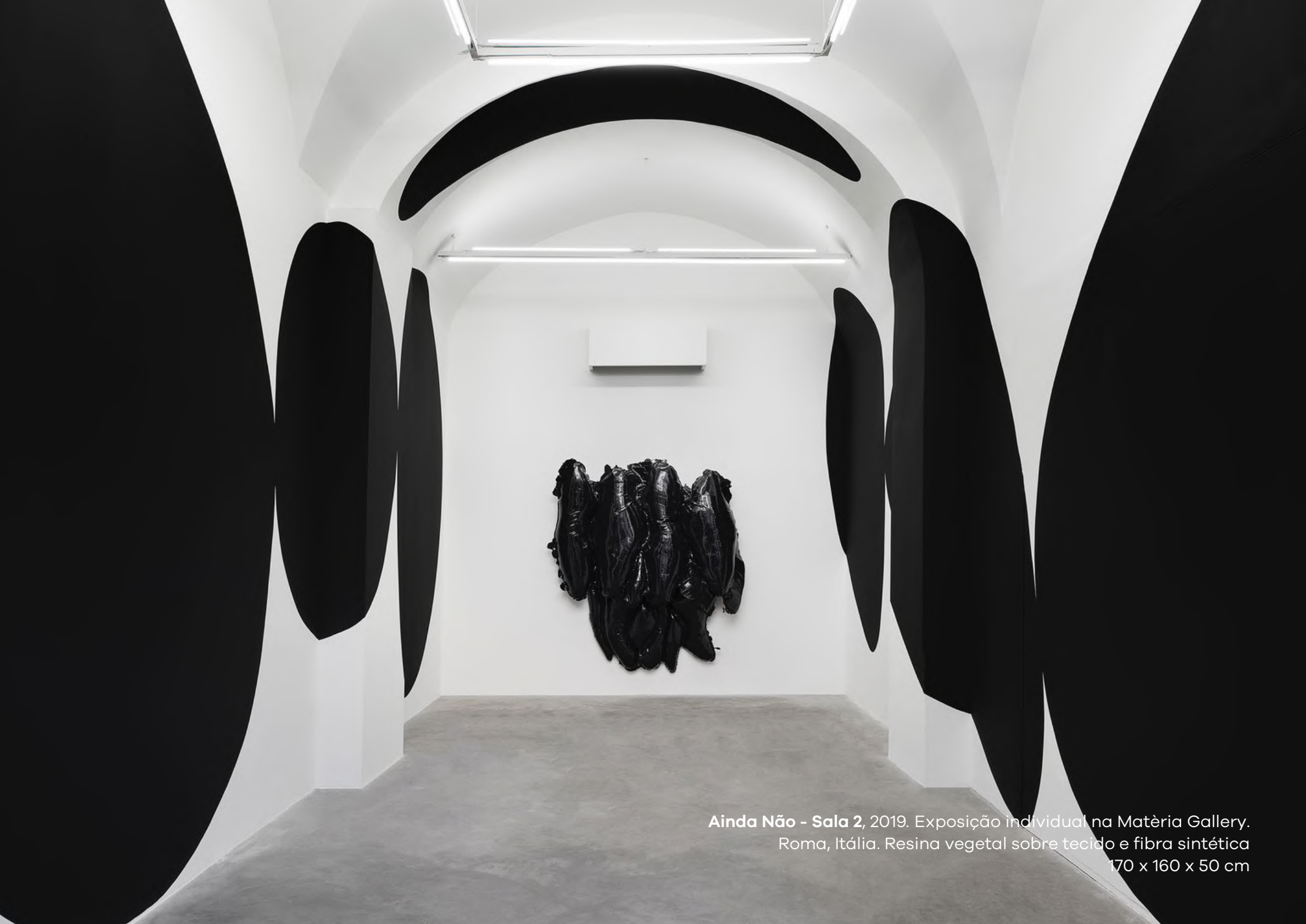
Ainda Não - Sala 2 , 2019. Exposição individual na Matéria Gallery. Roma, Itália. Resina vegetal sobre tecido e fibra sintética 170 x 160 x 50 cm