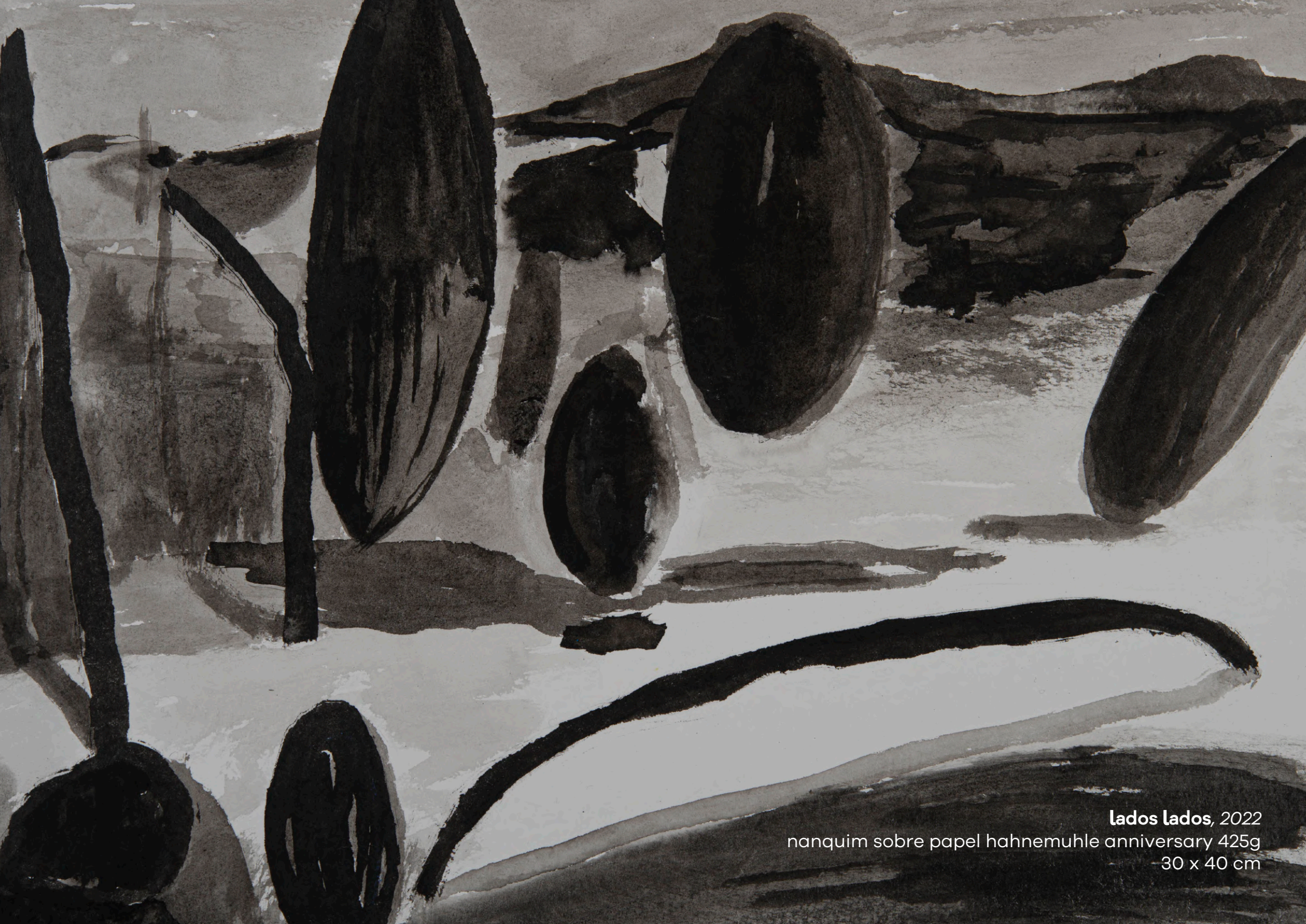
lados lados, 2022 nanquim sobre papel hahnemuhle anniversary 425g 30 x 40 cm