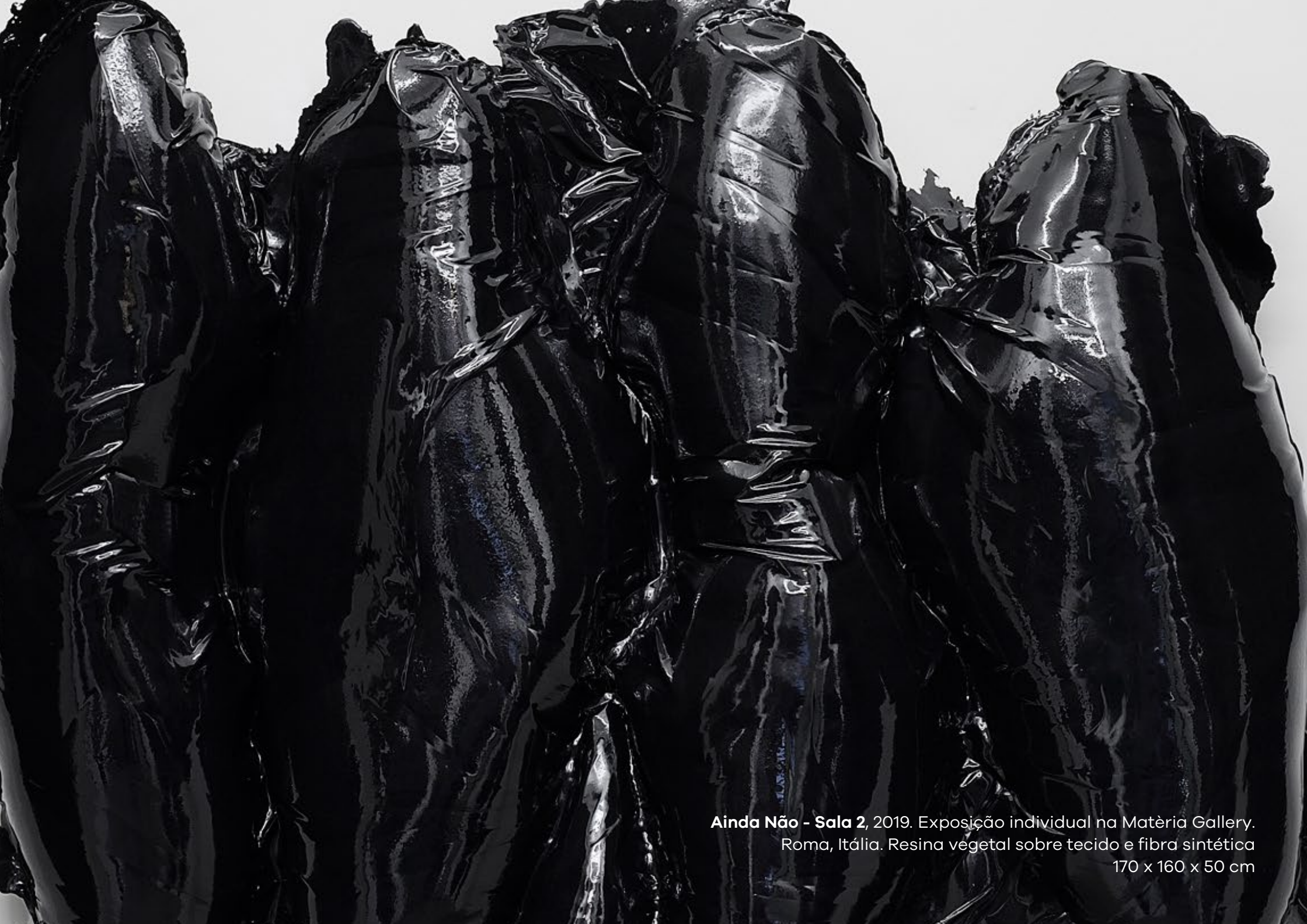
Ainda Não - Sala 2 , 2019. Exposição individual na Matéria Gallery. Roma, Itália. Resina vegetal sobre tecido e fibra sintética 170 x 160 x 50 cm