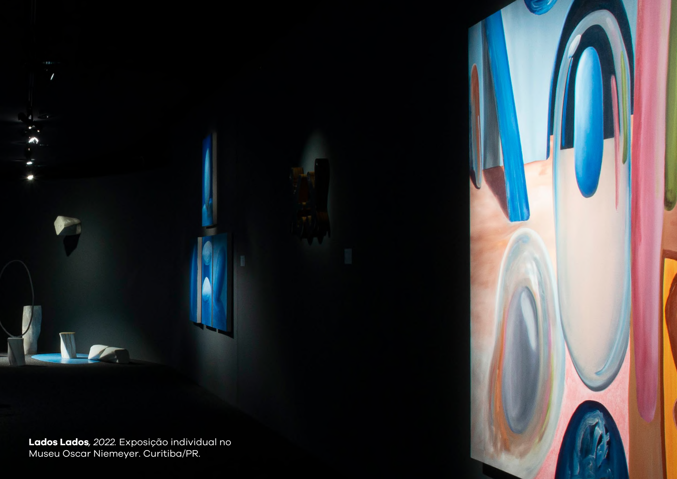
Lados Lados , 2022. Exposição individual no Museu Oscar Niemeyer. Curitiba/PR.