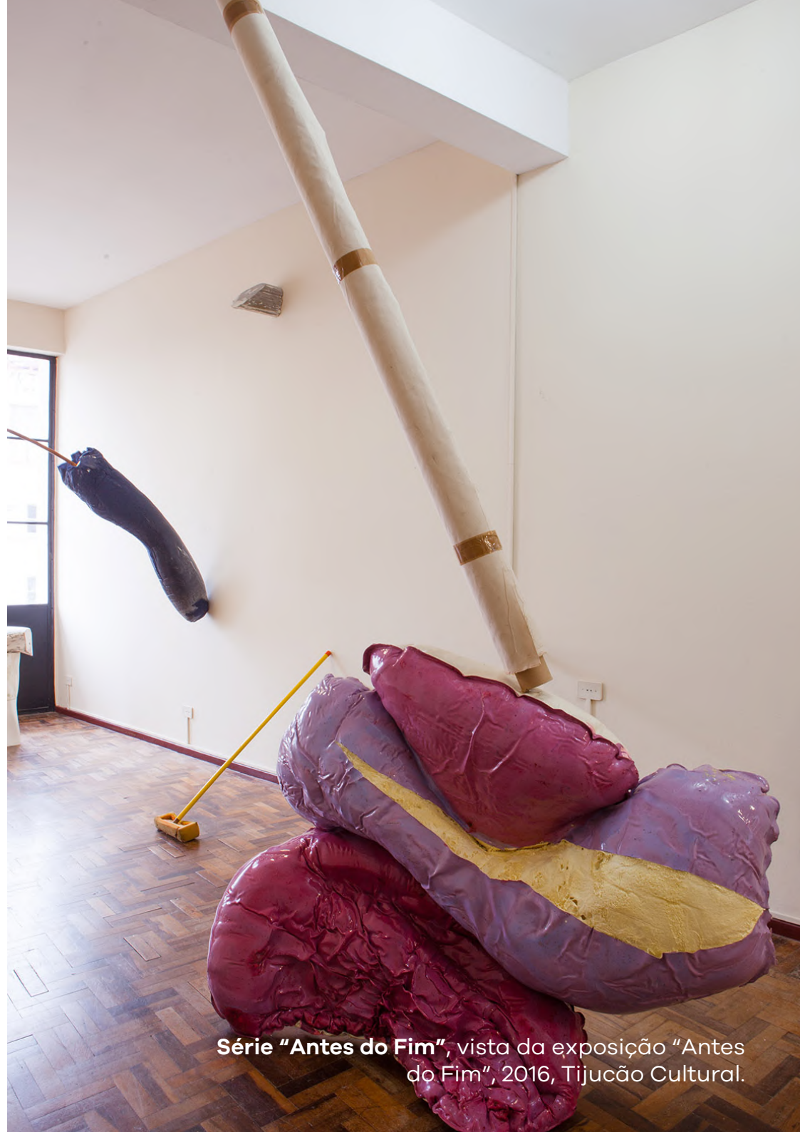
Série "Antes do Fim", vista da exposição "Antes do Fim", 2016, Tijução Cultural.