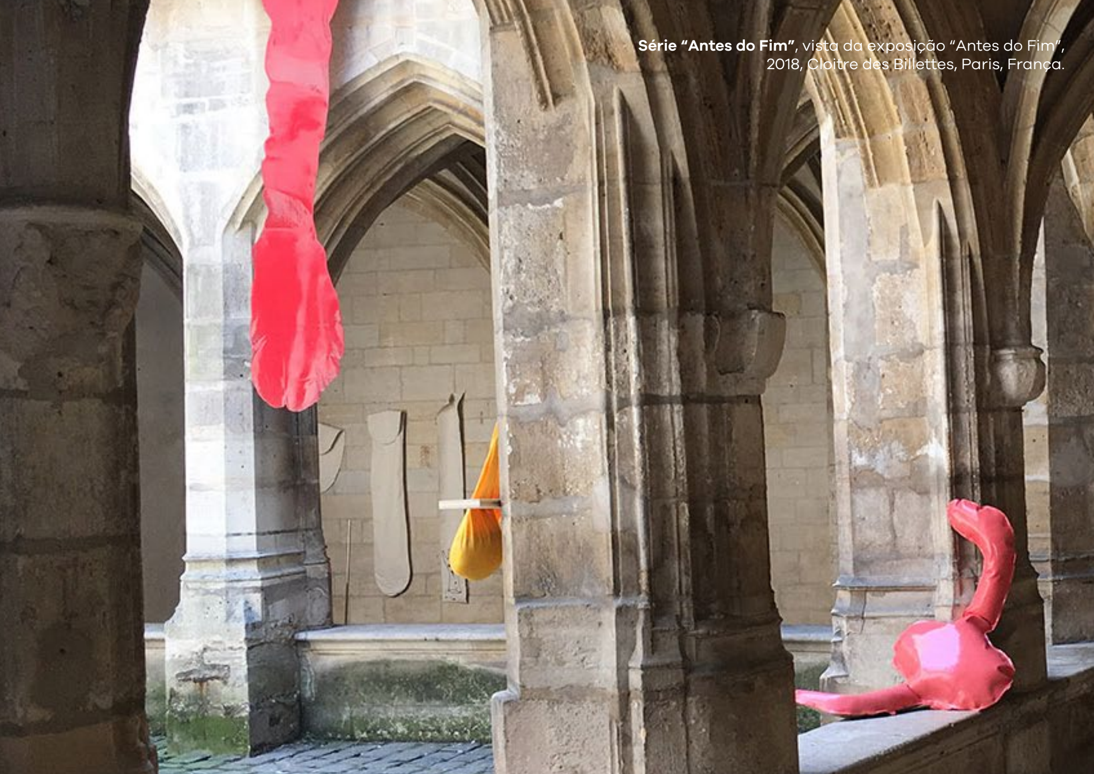
Série "Antes do Fim", vista da exposição "Antes do Fim", 2018, Cloître des Billettes, Paris, França.