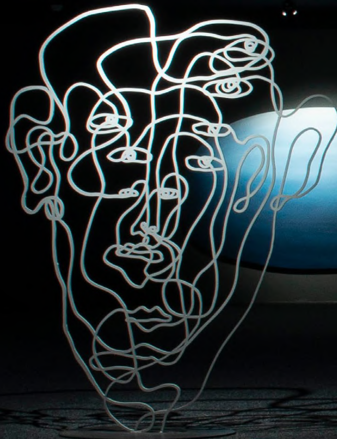
Lados Lados , 2022. Exposição individual no Museu Oscar Niemeyer. Curitiba/PR.