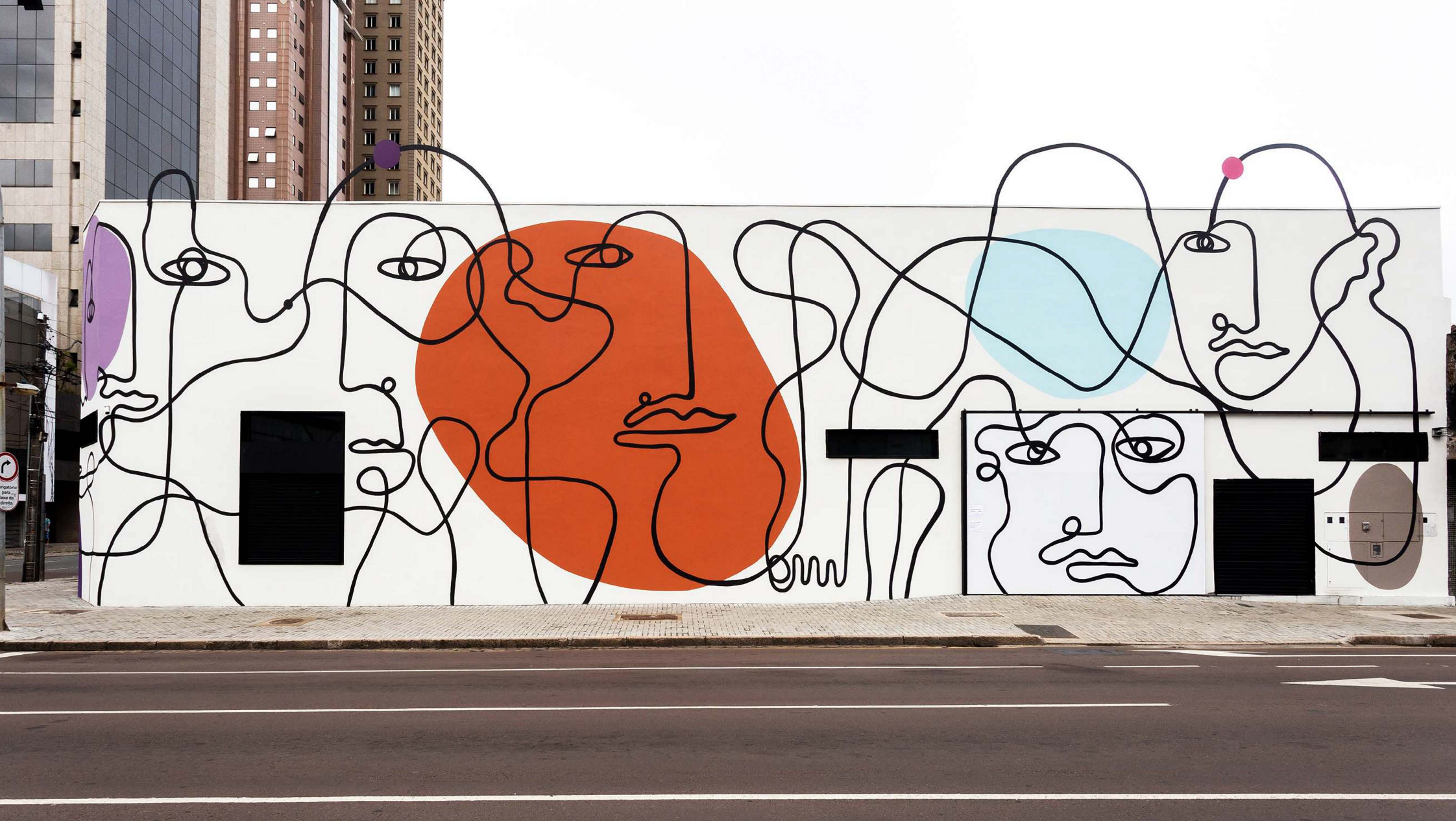
Série "Murais", "Cidade Viva", 2023. Tinta acrílica e aço. 9 x 38 metros, Curitiba