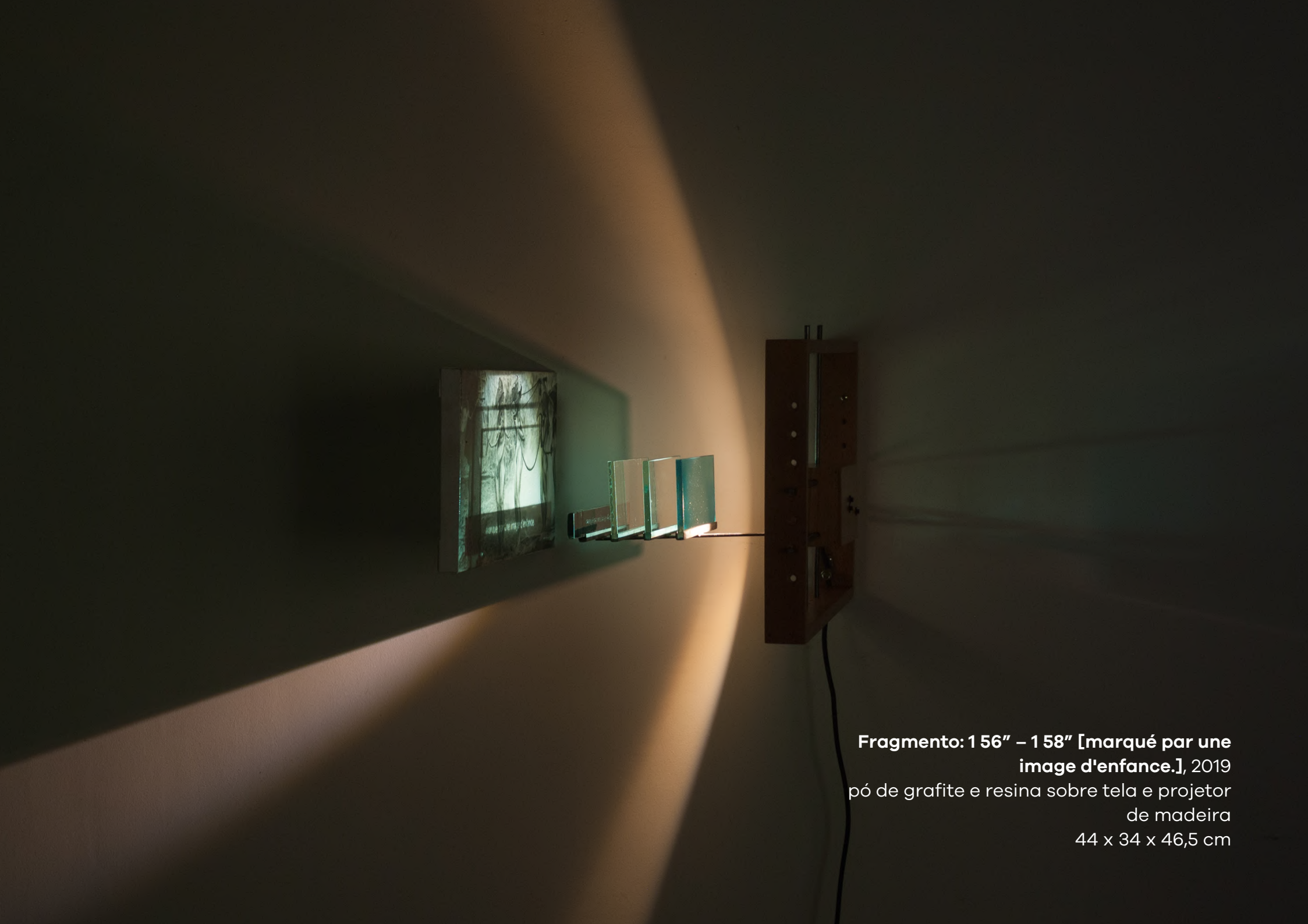
Fragmento: 1 56" – 1 58" [marqué par une image d'enfance.], 2019 pó de grafite e resina sobre tela e projetor de madeira 44 x 34 x 46,5 cm