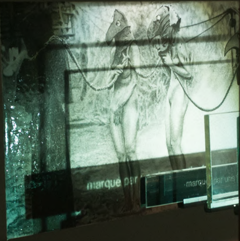
Fragmento: 156" – 158" [marqué par une image d'enfance.] , 2019 pó de grafite e resina sobre tela e projetor de madeira 44 x 34 x 46,5 cm