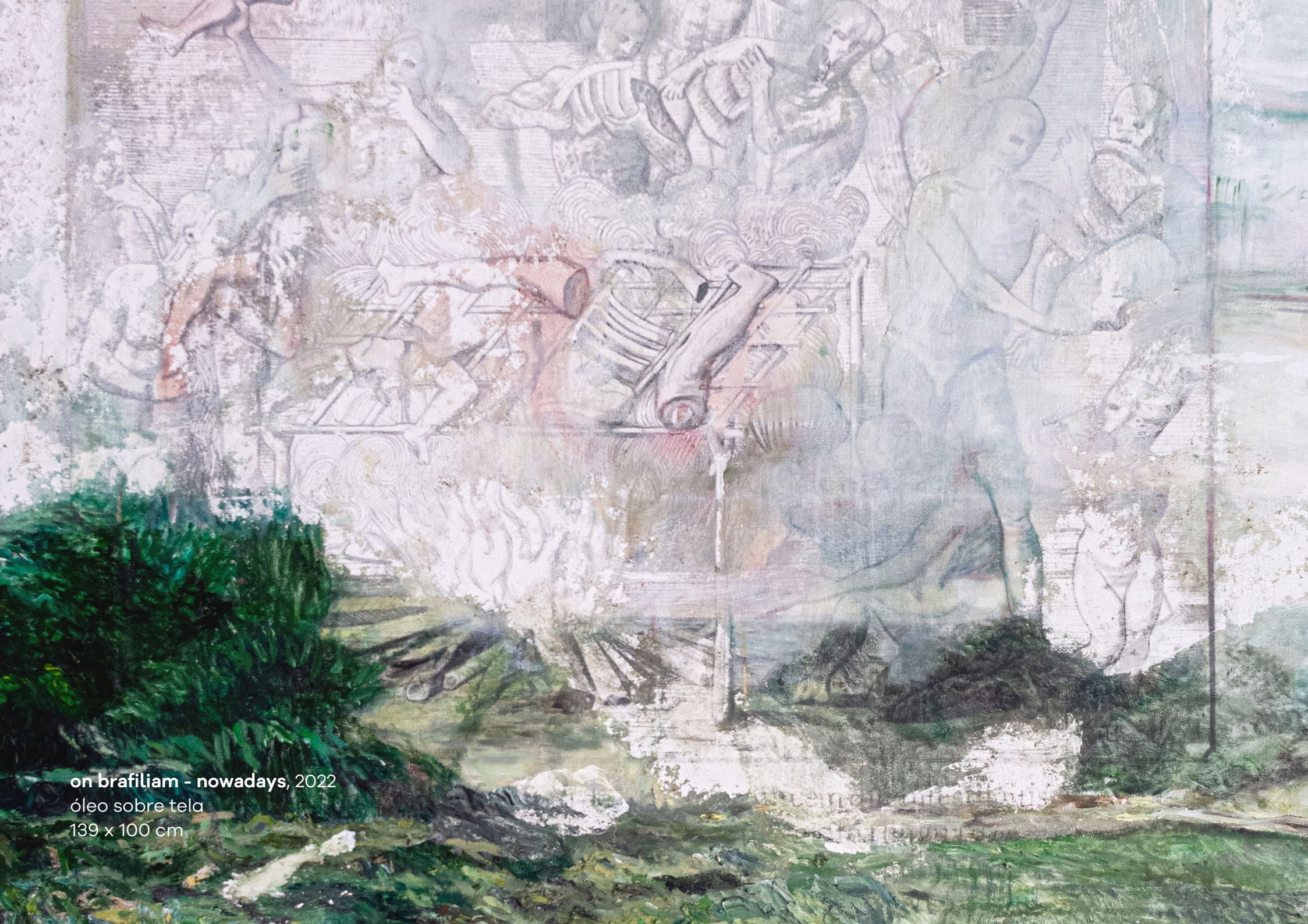
on brafiliam - nowadays, 2022 óleo sobre tela 139 x 100 cm