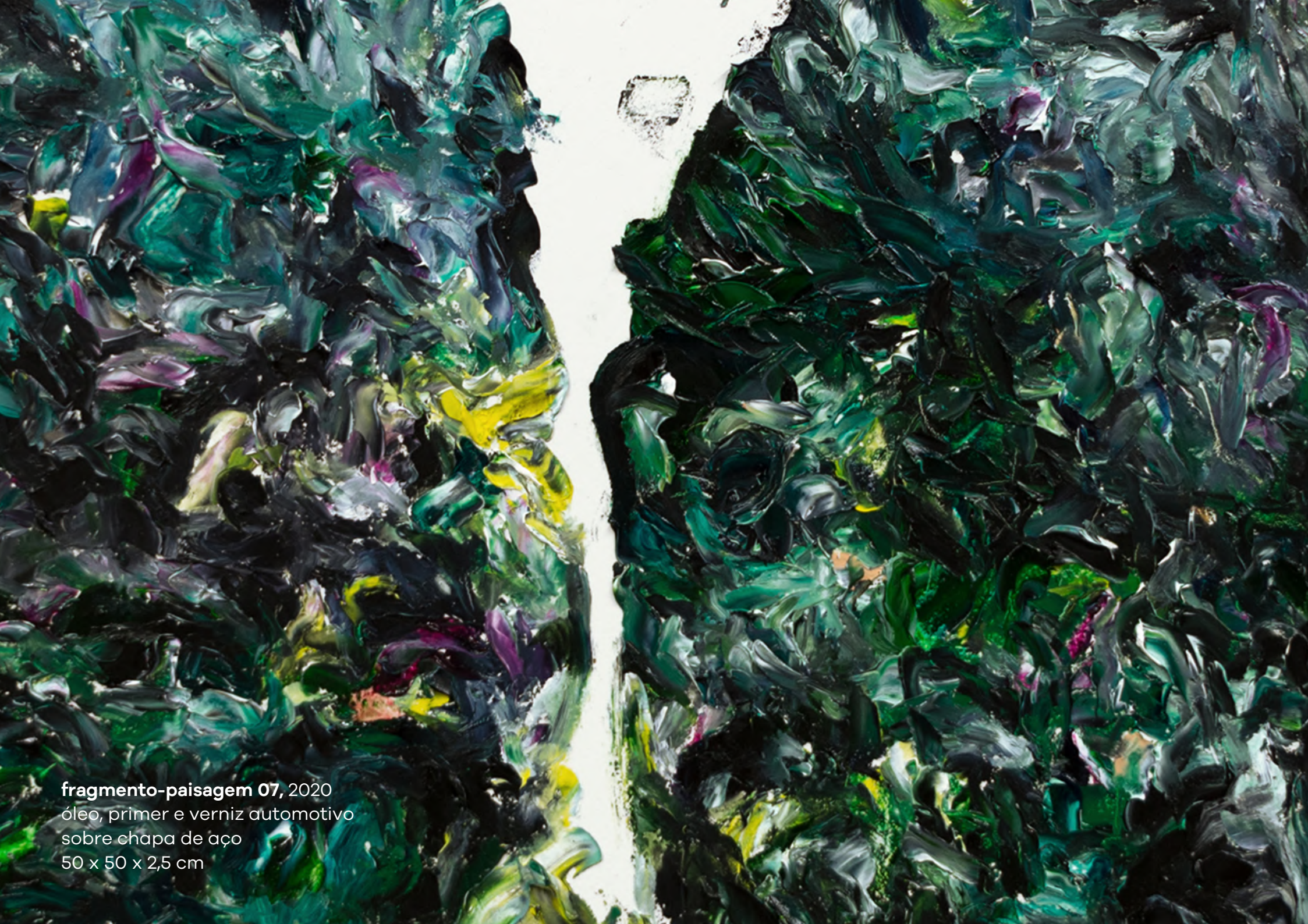
fragmento-paisagem 07 , 2020 óleo, primer e verniz automotivo sobre chapa de aço 50 x 50 x 2,5 cm